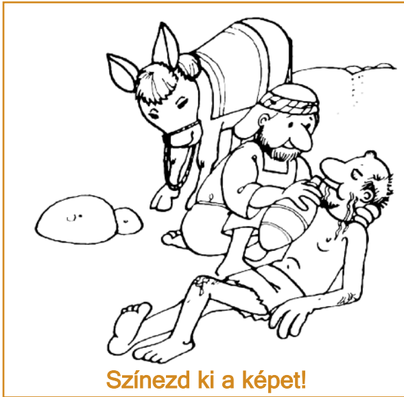
Színezd ki a képet!

Egy nap egy zsidó tanító megkérdezte Jézust: „Ki a felebarátom?” Jézus elmesélt neki egy történetet, hogy bemutassa, a felebarát az, akinek segítségre van szüksége. Egy ember egy Jerikó nevű városba ment. Útközben rablók támadták meg, kifosztották, és otthagyták összeverve az út mellett.